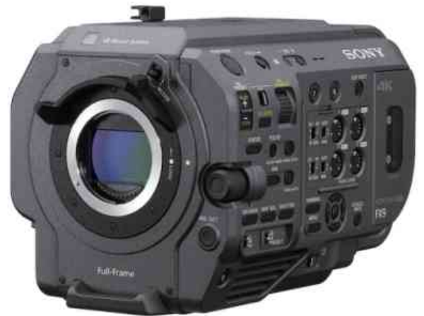
Logotipo de Sony en sus contextos de uso

Desde mi percepción, el único mensaje directo que transmite esta marca, puesta en sus contextos de uso, es su mensaje identificatorio más elemental; es decir, «esto lo dice» o «esto lo fabricó Sony». Y lo mismo sucede con todas las marcas, sean del tipo que sean. Todo mensaje adicional que se le quiera adjuntar a los signos identificadores de una organización o producto, se evapora automáticamente por el solo hecho de que al verlos en su contexto, los percibimos como firmas y no como mensajes.